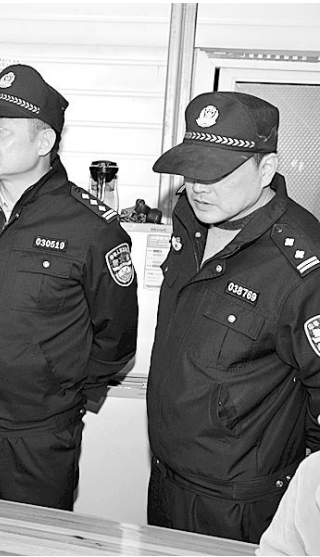
社区民警在警务站工作

首先是扎实推进标准化建设。2014年6月,文成县人民政府办公室制定下发了《关于进一步加强社区警务工作的通知》,在人、财、物及职级待遇上为社区警务改革提供了有力保障,投入专项资金在全县2个警务站、8个警务室、39个警民联系点等全部按照统一标准建设。在警力配置上,精简机关警