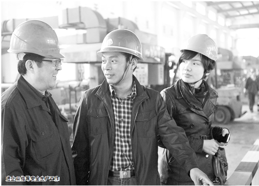
企业指导安全生产

作为一家机械设备生产企业,巨人通力电梯有限公司把机械安全生产作为重中之重。走进企业生产车间,首先映入眼帘的是一面内容丰富的安全墙,上面各类安全管理制度和操作规程一应俱全,有些还是用妙趣横生的漫画呈现的。“漫画可以把生硬的规章制度变得生动,更容易让员工入脑入心。”企业安全主管说。 严格按照企业安全生产标准化来进行安全管理,“巨人”因此成为了国家二级安全生产标准化企业,2015年又被评为诚信管理A级企业。 “企业安全生产诚信体系建设是社会信用体系建设的重要组成部分,它和安全标准化建设都是推动企业实现科学发展、安全发展的重要途径。”湖州市安监局局长章新泉说。 早在2011年,湖州市安监局便创新安全生产监管方式,在全省率先融合推进企业安全生产标准化和诚信体系建设,实行两者“同步创建、同步推进、同步申报、同步考核、同步管理”,有效推进企业主体责任落实,实现企业安全发展和社会长治久安。 企业安全生产标准化建设是指,通过建立安全生产责任制,制订安全管理制度和操作规程,排查治理隐患和监控重大危险源,建立预防机制,规范生产行为,使各生产环节符合有关法律法规和标准规范的要求,不断加强企业安全生产基础建设。 企业安全生产诚信体系建设是指,根据企业不同安全生产诚信等级,采取相应的激励和约束措施,