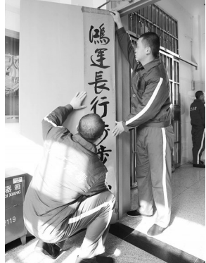
戒毒人员正在贴春联