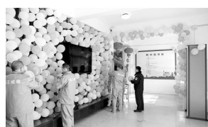
戒毒人员正在装点宿舍大厅

2016年2月7日,农历除夕。除夕是辞旧迎新的日子,戒毒人员也希望能改去旧习迎接新生。当天一早,浙江省拱宸强制隔离戒毒所里的戒毒人员就开始装扮宿舍了。贴福字、挂灯笼,这里到处洋溢着春节喜庆的气氛。