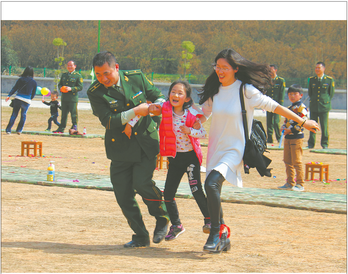
警嫂萌娃进警营 “三八”节即将到来,昨天上午,武警衢州支队邀请百余名警嫂和孩子走进警营,参观支队史馆,观摩科目训练,参加亲子游戏、幸运大抽奖等,欢庆佳节。

“李克强总理的政府工作报告,博得了代表们的热烈掌声,这掌声反映了民意,也反映了代表的心声。”快人快语的郑雪君代表拿过话筒就开讲。 郑雪君说,总理报告在谈及“十三五”时期主要目标和重大举措中指出,持续增进民生福祉,使全体人民共享发展成果,要坚决打赢脱贫攻坚战,我国现行标准下的农村贫困人口实现脱贫,贫困县全部脱帽,解决区域性贫困。对2016年的重点工作,总理也在报告中强调要实施脱贫攻坚工程,深入开展定点扶贫、东西协作扶贫,支持社会力量参与脱贫攻坚。“去年,我们浙江在全省消除了家庭年人均收入低于4600元的绝对贫困现象,26个原欠发达县也全部摘帽,实现了‘不把贫困带人十三五’。”郑雪君说,在定点扶贫、东西协作扶贫上,温州已经先行一步,以她所在的“温州晚报雪君工作室”为例,他们已与陕西延安温州商会商定,和当地一起对延安梁家河村贫困户精准扶贫。 “借全国两会的机会,我也倡议全国人大代表、政协委员一起参与脱贫攻坚战,不落下一个贫困地区、不丢下一个贫困群众!”郑雪君说。 (下转7版)