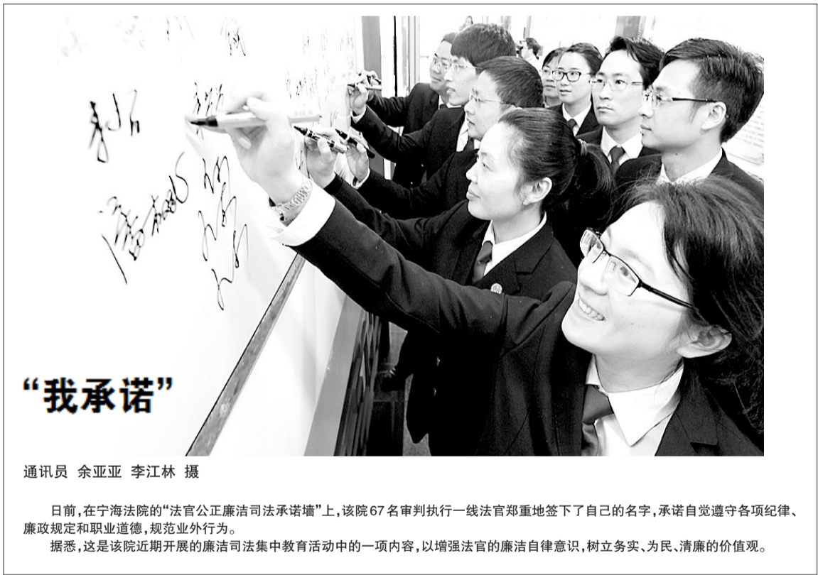
日前,在宁海法院的“法官公正廉洁司法承诺墙”上,该院67名审判执行一线法官郑重地签下了自己的名字,承诺自觉遵守各项纪律、廉政规定和职业道德,规范业外行为。 据悉,这是该院近期开展的廉洁司法集中教育活动中的一项内容,以增强法官的廉洁自律意识,树立务实、为民、清廉的价值观。

法院提起离婚诉讼。 一审法院认为,项某、王某结婚多年,育有一女,建立了家庭,本应充分珍惜;然而根据审理查明的事实,王某与项某分居生活期间,项某曾持刀至王某娘家威胁王某,此举虽并未给王某的身体造成直接伤害后果,但已给王某在精神造成了严重伤害,已构成家庭暴力,严重影响夫妻感情。而且,项某经传唤无正当理由拒不到庭,表明他对婚姻关系的维持也缺乏积极的态度。因此,法院认定项某和王某夫妻感情确破裂,判决离婚,同时女儿由项某抚养至独立生活,王某支付子女抚养费合计10万元。 项某对一审判决不服,提出上诉。 项某认为,当时他是以为王某背叛自己,忍无可忍才在机场打人的。这件事之后,王某就搬去了娘家,要和他分居,项某去妻子娘家前喝了很多酒,才出现了拿刀大吵的一幕。项某并不认为自己构成家庭暴力。 但王某的律师指出,两人结婚这么多年,项某时常对王某动手,项某父亲去世那天,也曾打过王某。 家事合议庭经过二审后,当庭宣判驳回上诉,维持原判。 “在我们审理的婚姻家庭纠纷类案件中,有许多都涉及家庭暴力。”温州中院民一庭副庭长李佩认为,要探索建立反家庭暴力的整体防治网络,形成确保人身安全保护裁定有效执行的合力。 据悉,温州中院的家事审判合议庭,除审理上述婚姻家庭纠纷案件外,还重点审理继承纠纷及其他纠纷,由具备丰富民事审判经验和熟悉妇女工作的资深法官组成,且必须配备女性法官和女性人民陪审员。“接下来,温州两级法院将陆续在民事审判庭设立家事审判合议庭,有条件的法院还将增设家事审判庭。”夏孟宣表示。