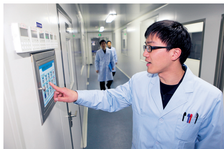
开启空气净化系统,做好实验准备