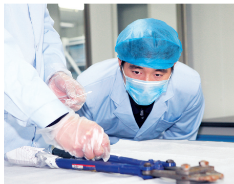
民警在一把大力钳上提取微量物证