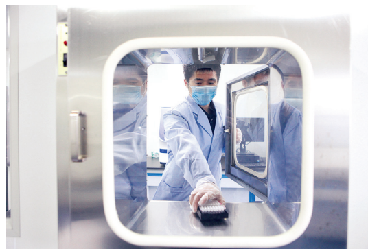
通过传递窗接收送检样本

实验室里,几位毕业于医学院校的年轻人探讨学术问题,激情飞扬。同事称他们是刑侦战线上“离象牙塔最近的人”。他们大多默默无闻,远离鲜花和掌声。唯有“蓝白灰”的世界,是他们始终坚持的梦想。