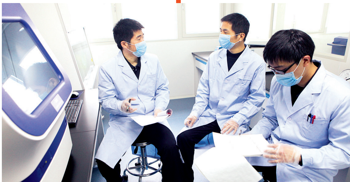
在实验室讨论案情时,他们激情飞扬

手机网络买保险 赢客户节大礼 官网投保 www.epicc.com.cn 电话投保 400-1234567