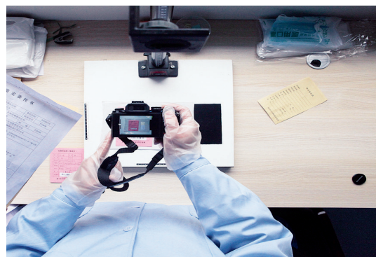
对送检检材进行拍照确认