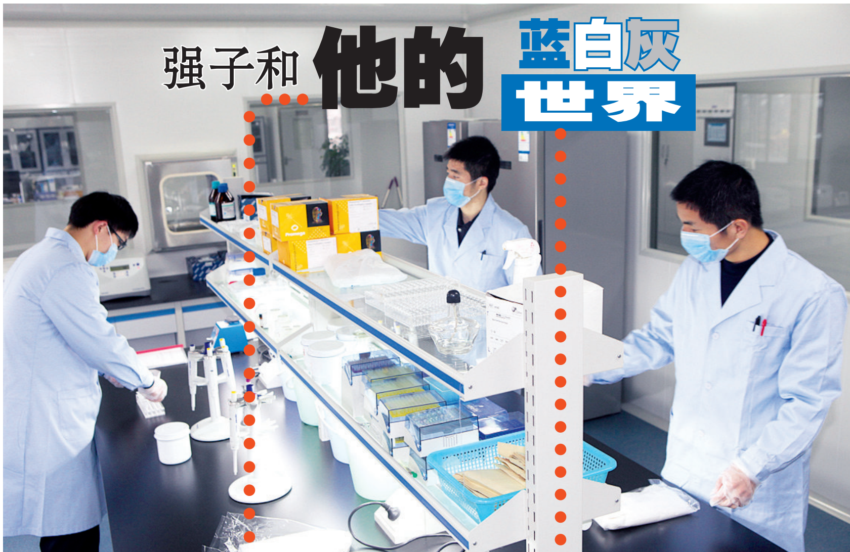
安静的实验室里,鉴定员们各自忙碌着