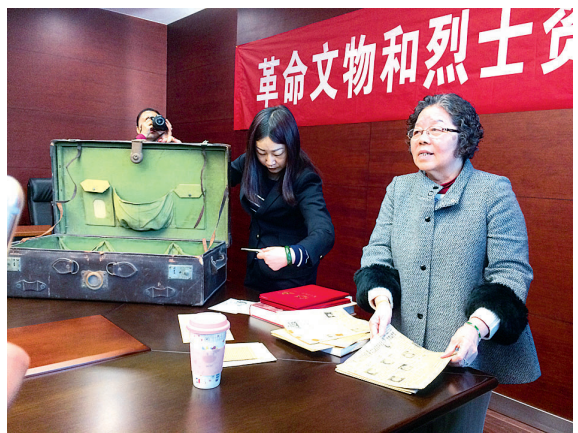
周芸正在介绍捐献的资料

小学庆祝建党95周年爱国主义教育案例征集活动、清明节广场群众红歌会、网上祭英烈活动等。