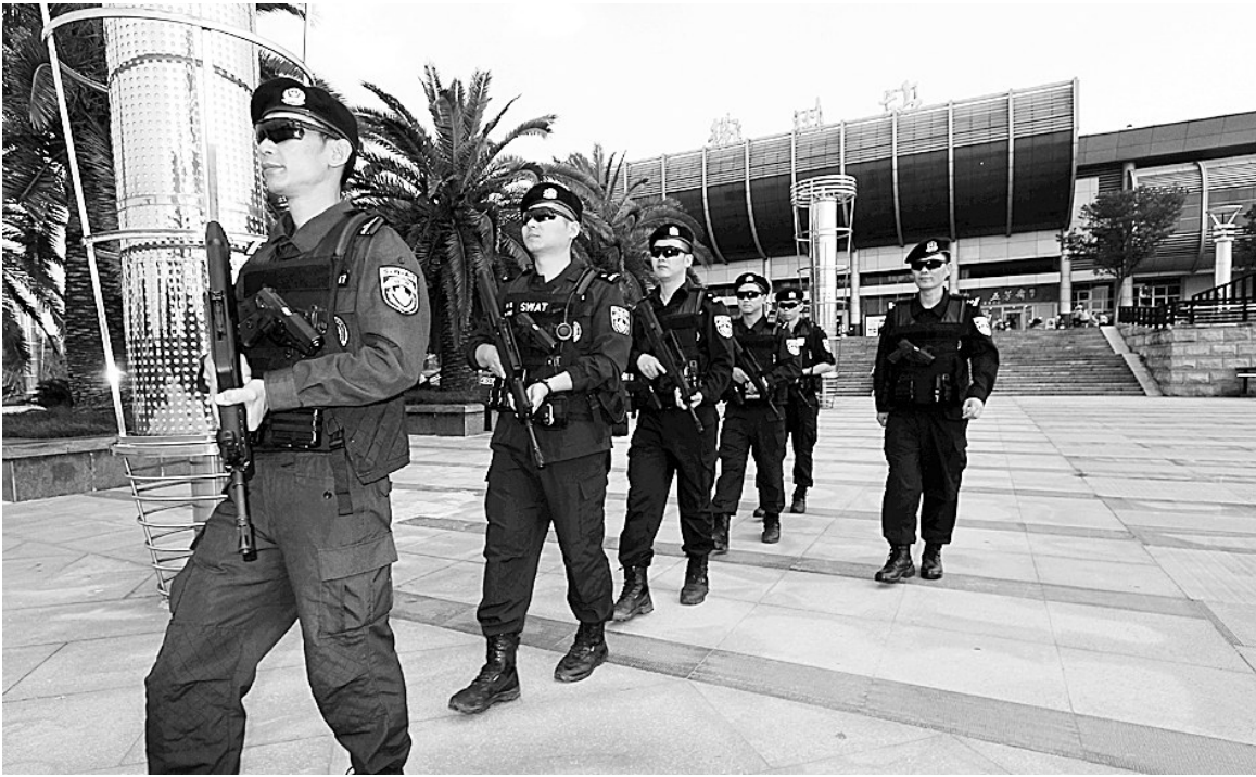
“山鹰突击队”在衢州火车站前广场巡逻

与此同时,衢州市在打击犯罪、保障民生方面也毫不松懈。2015年,衢州市“两抢”案件同比下降33.9%,全年296天实现“两抢”零发案;破获通讯(网络)诈骗案件232起,同比上升262.50%;破获涉黑涉恶案件24起,打处153人;依托“百城禁毒会战”“旋风扫毒”等专项行动,破获涉毒刑事案件125起,打处249人;破获涉传销刑事案件18起,打处76人;侦破“食药环”犯罪案件16起,打处43人。