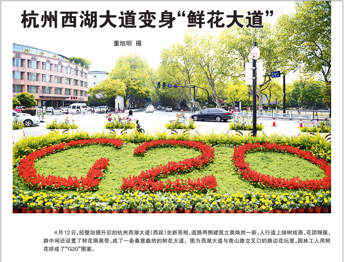
杭州西湖大道变身“鲜花大道” 4月12日,经整治提升后的杭州西湖大道(西段)全新亮相,道路两侧建筑立面焕然一新,人行道上绿树成荫、花团锦簇,路中间还设置了鲜花隔离带,成了一条春意盎然的鲜花大道。图为西湖大道与南山路交叉口的路边花坛里,园林工人用鲜花拼成了“G20”图案。

这段时间,之江公证处主任许金平一直在指挥部现场忙碌,忙着解答居民的法律问题,忙着安排办理各项公证。“我们公证处一半的力量都在现场办公,不仅要确认签约时间,还要审查确认签约主体资格,通过摇号确定第三方评估单位等。”许金平告诉记者,水电社区的房屋属性非常复杂,不仅涉及到房改房、二手房,还因产权人去世、房屋抵押贷款等情况带来许多隐性共有人问题,因此,公证的及时介入很有必要。 水电社区的王老太,丈夫去世多年,留有一儿两女。王老太和儿子在水电社区各有一套住房,二人感情常年不和,这次又因为调产收购与货币收购的选择问题而闹出了不快。原来,儿子为了改善住房,想借机将母亲与自己的房子均选择调产收购方式,以调换成较大的户型,而王老太执意选择货币收购。 2月28号,离集中有奖签约还剩最后一天,王老太的三个子女前来向许金平咨询求助。许金平从继承法和产权登记的角度,为他们耐心地理清了两套房的继承关系和产权关系,并指出了选择不同收购方式的利弊。 “首先,因老太太的丈夫已故,从继承角度来说,这套房子里老太太占了八分之五的份额,三个子女各占八分之一的份额。如果儿子以母亲的房屋调产,今后的新房他只占有八分之一的产权份额,对以后的转让、抵押、继承都会有影响,而如果以自己的房屋调产,则产权全部是自己的。其次,从现实考虑,如果顺从母亲意愿,让她选择货币收购方式,儿子则可以得到八分之一份额的款项,改善住房的资金也就有了着落。”许金平的分析,化解了大家心中的疑虑和纠结,姐弟仨拍手叫好,当天就带着老母亲完成了签约,并办理了现场公证,一起拖而未决的家庭纠纷成功化解。 这样的公证故事还有很多。记者了解到,目前之江公证处已办理1000多件公证事项,涵盖了收购协议公证、继承公证、委托公证、选房抽号公证、房屋拆除现场监督公证等多个类别。为了减轻水电社区居民的办证负担,在公证办理中涉及需要死亡证明、亲属关系证明、产权证明等相关证明的,都由公证处负责调取,不用居民四处跑腿。 (下转2版)