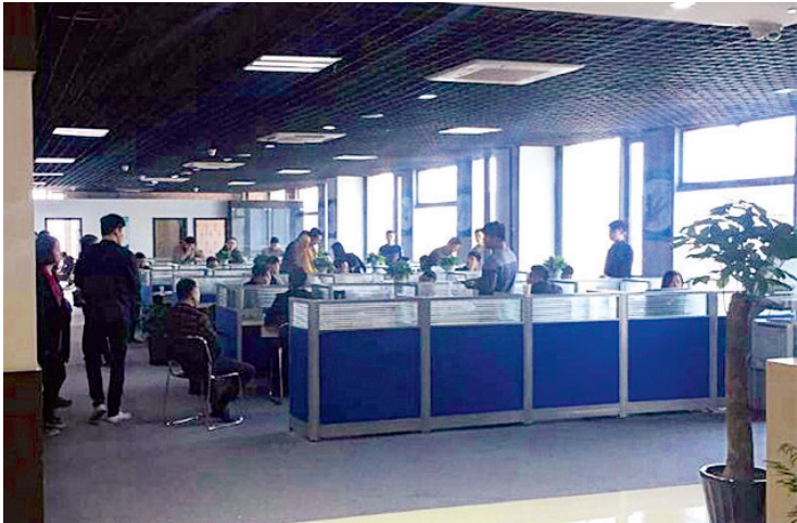
诈骗团伙租下写字楼成立公司

“我们是工信部直属的公司,你公司的关键词已被人通过不法途径抢注了,我们可以通过工信部的关系再抢注回来,但是网络关键词必须做全网数据保护,这样以后别人就抢不走了,然后我们才可以收购。”一名自称公司业务部王经