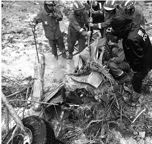
救援人员撬开被泥石流冲埋的大货车的门窗,以确认车内有无人员被困

痒难耐,请了假打算去医院看病,面对突发灾情,他悄悄加入了救灾队伍中。就这样,忍着身上的奇痒,在雨中疏导交通,这名18岁的交警学警,一口气忙了10个小时。