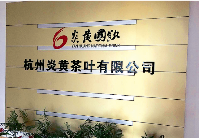
杭州炎黄茶叶有限公司董事长“失联”

昨天,记者进行了实地探访,发现文三路121号为一家酒店,酒店前台服务员说,整栋楼3至9楼都是客房,没听说过有“龙炎电商”这样一家公司。