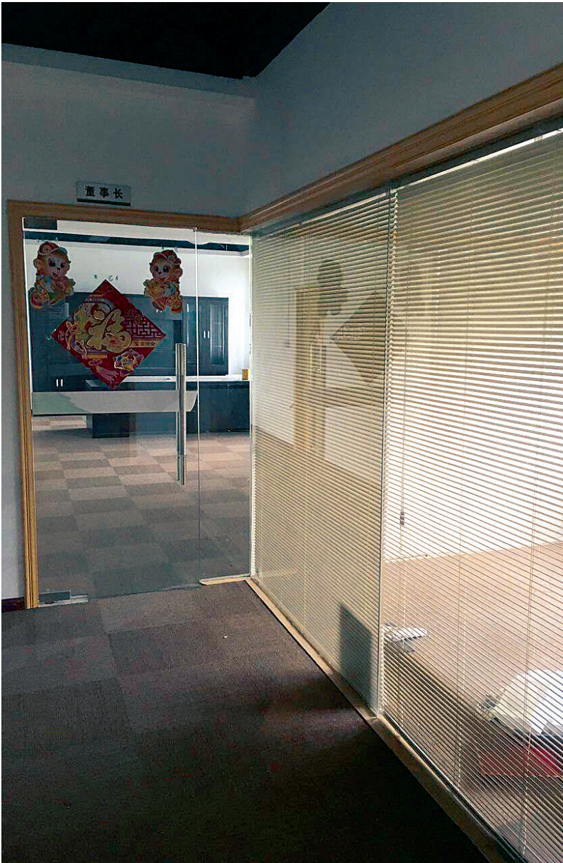
龙炎电商的办公室已人去楼空

被害人提到,龙炎电商对外宣传说,与杭州炎黄茶叶有限公司(杭州炎黄茶叶有限公司在上海股权交易中心中