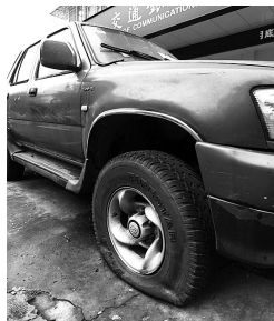
停放在西溪路14号的长城SUV