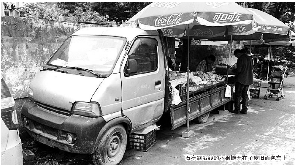
石亭路沿线的水果摊开在了废旧面包车上

浑身积满灰尘，车胎也已瘪了，长期停在路边甚至公共泊位上不“挪窝”……这些车辆被称作“僵尸车”。 “僵尸车”长期占用公共资源，既影响市容市貌，又存在诸多隐患，还给正常车辆和行人的出行带来不便。5月17日，杭州市公安局交通警察局、杭州市城市管理委员会（杭州市城市管理行政执法局）、杭州市住房保障和房产管理局宣布，于5月20日至9月30日期间，对长期占用城市道路、公共场所、居住小区内停放的外观残旧破损、轮胎干瘪、逾期未参加安全检验、失去使用功能的机动车辆开展集中整治清理行动。“僵尸车”的车主在5月28日前，如未自行清理、驶离车辆，上述三部门将实施强制拖移清理。（本报5月18日已有报道） 一周过去了，还有多少“僵尸车”不肯“挪窝”，仍然趴在原地给杭州这座美丽的城市“添堵”呢？昨天，记者进行了实地探访。