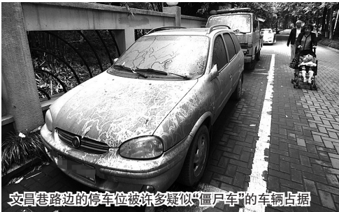
文昌巷路边的停车位被许多疑似“僵尸车”的车辆占据