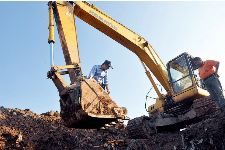
警方动用挖掘机进行作业