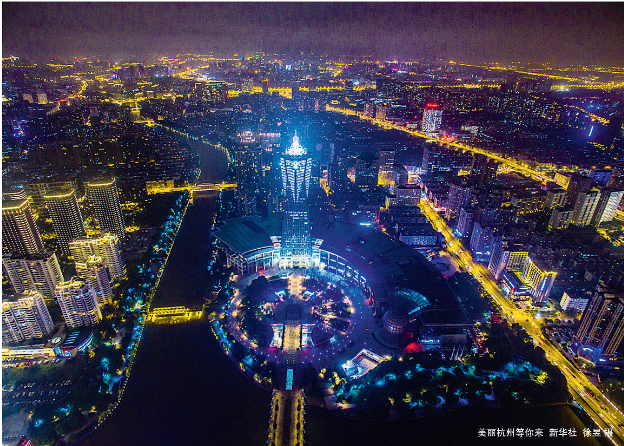
美丽杭州等你来

“我们期待通过本次家事审判方式和工作机制改革,不断提升我院家事审判的专业化水平,倡导文明进步的婚姻家庭伦理道德观念,维护社会公序良俗。”鄞州法院分管家事审判工作的副院长郑贤达在新闻发布会上总结道。