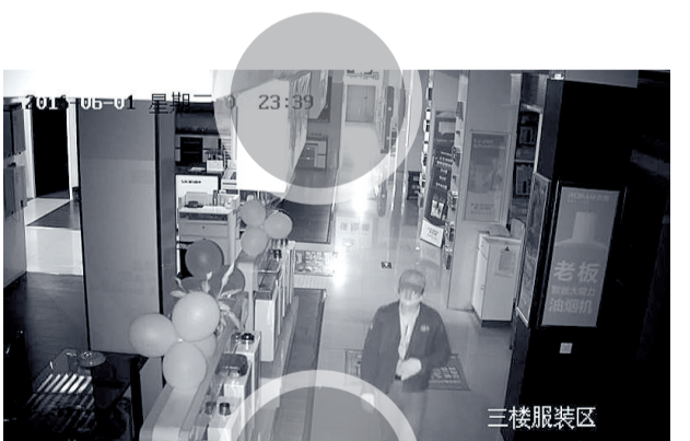
商场监控视频拍下的画面