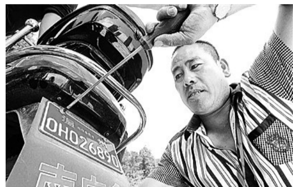
温州公安在全市范围内启动电动车防盗登记备案工作

随着城市化不断推进,人口流动的步伐不断加快,社会治安状况也变得越来越复杂。通过近20年的摸索和实践,全省各地公安机关采取多种方式有效整合资源,最大限度将警力摆上街面、沉入社区,逐渐形成一张动态化、多元化、智慧化的社会巡逻防控网,24小时守护百姓平安。