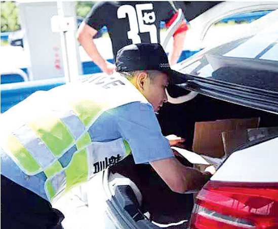
萧山警方检查过路车辆

接下来,地铁分局将在全线站点设立安检提示标牌,引导乘客文明乘车,积极配合安检工作;督促运营单位、保安公司加强对安检人员的教育培训,对于准确发现并及时处置的人员给予奖励;部分站点安检机前置,杜绝类似递包进站的行为,并在全线加强警犬巡逻工作,多手段高