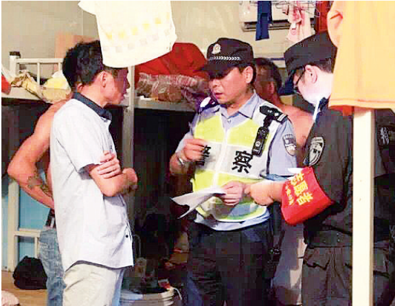
上城警方入户排查

从7月15日10时起,杭州市公安机关还开展了以巡查设卡、流动人口清查、治安打击整治为主的夏季治安大整治首次集中清查行动。杭州警方根据辖区治安特点,以案件高发、治安复杂的路段、区域为重点,采取车巡步巡结合、着装巡逻和便衣守候结合等形式,加强社会面巡逻防控工作,突出重点道路卡口、治安复杂部位的公开设卡查缉工作。以承租对象多且复杂的出租房屋为重点,加强流动人口临时性、短暂性落脚点的管理,对辖区内的旅馆、民宿、农家乐、网吧、大型停车场、市场仓库、桥梁涵洞等场所开展集中清查。对侵财性案件高发和涉赌涉恶犯罪突出的重点区域,组织开展“点穴式、外科手术式”精准打击和定点清除。对治安状况复杂的城郊接合部、城中村、建筑工地、车站码头进行集中清理整治。