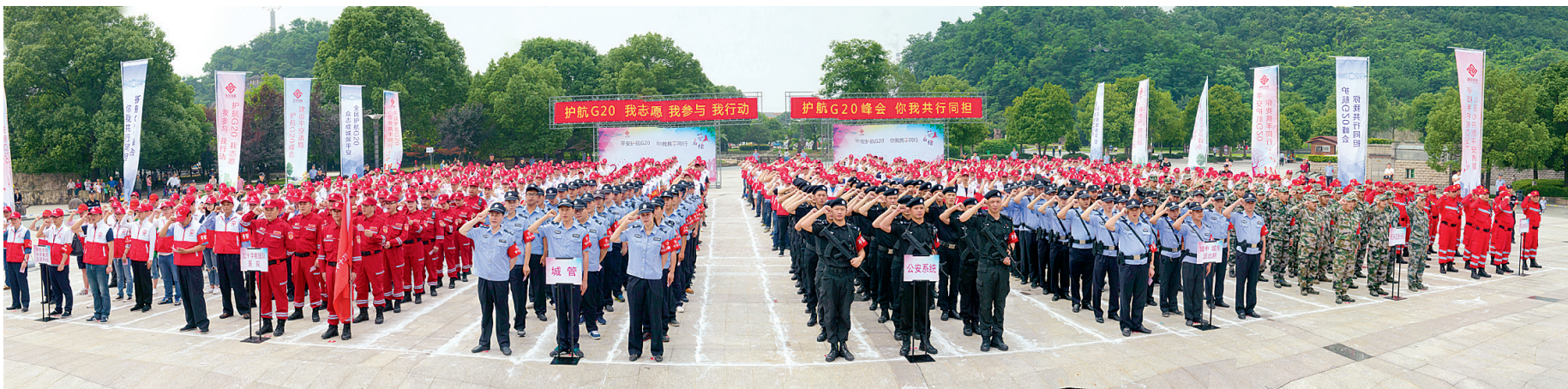
平安志愿者护航 G20 誓师大会现场