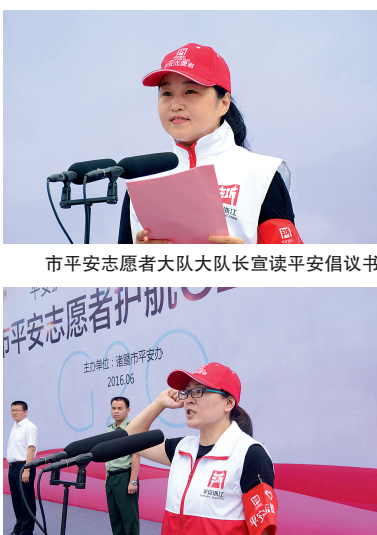
市平安志愿者大队大队长宣读平安倡议书