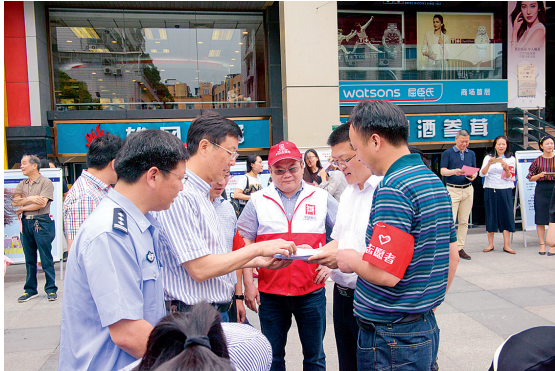
市领导现场推广平安浙江 APP