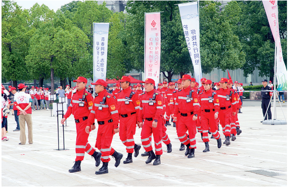
平安志愿者民安救援分队