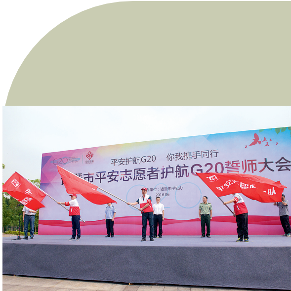
镇乡街道平安志愿者中队授旗仪式