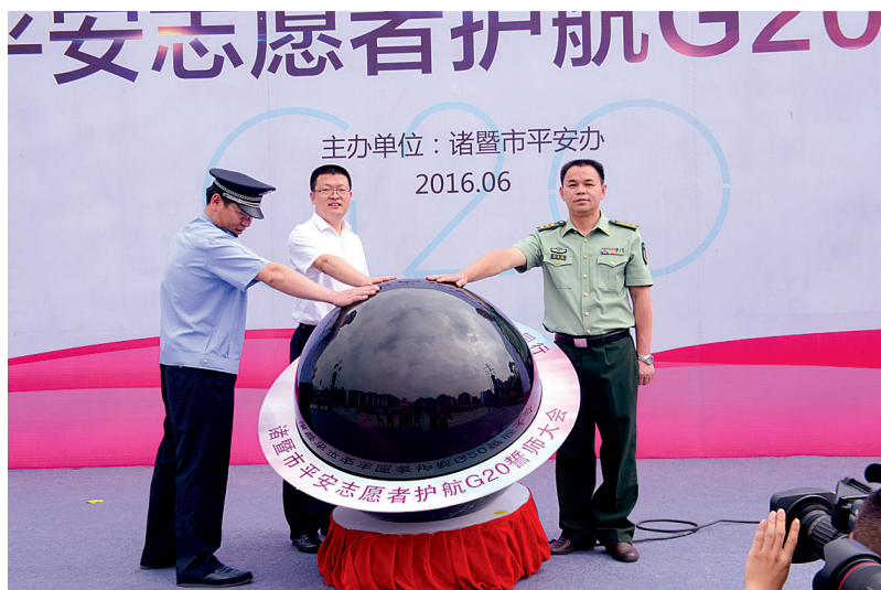
市领导按动平安志愿者护航 G20 誓师大会启动球