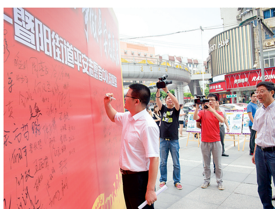
市委副书记、政法委书记王芬祥在签名墙上签字承诺

前不久,诸暨市“平安志愿者护航 G20 誓师大会”在城市广场举行。誓师大会上,暨阳街道、团市委及平安志愿者代表上台表态、宣誓。全市各乡镇(街道)、市级有关部门平安志愿者分队代表共 1000 余人参加会议并集体表态、承诺签名。大