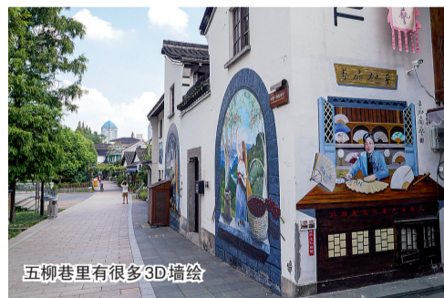
五柳巷里有很多3D墙绘