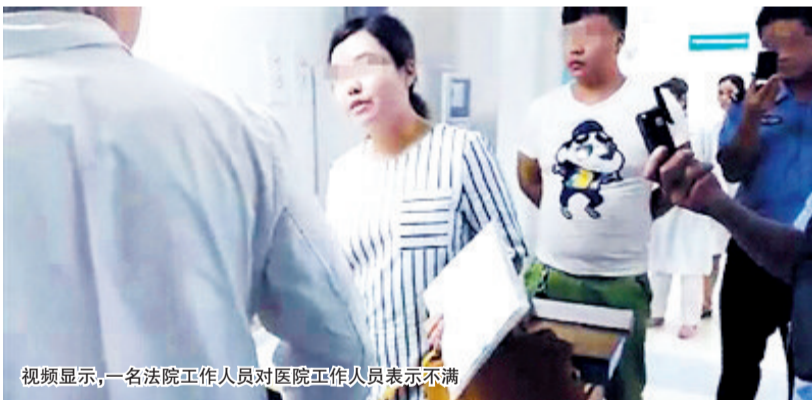
视频显示,一名法院工作人员对医院工作人员表示不满

员认为法院提供手续齐全,病案室应予以办理。由于此时已到中午下班时间,医务处人员答应“协调病案室下午上班后优先办理。”到下午3点,当法院工作人员再次来到病案室时,对方依旧提出需要出示身份证,双方再次就此产生争执,法院人员随后离开。