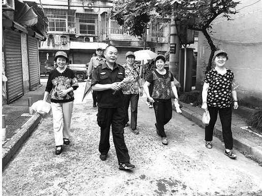
社区里的平安志愿者

文明的出行方式,那我就打心底感到欣慰、高兴。通过我们的努力,现在,文明出行的氛围越来越浓厚了。”