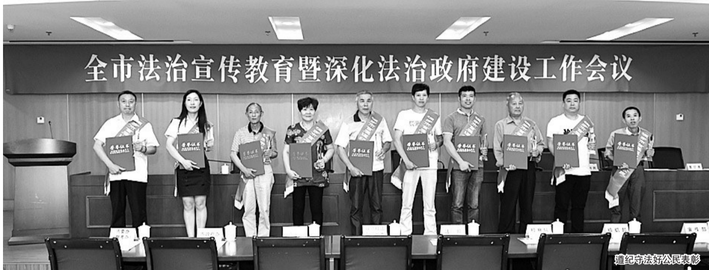
遵纪守法好公民表彰

“法治桐乡”,四字千钧重。普法工作从来不是一蹴而就的事情,每一个阶段,桐乡都精心谋划、认真实践。如今,站在“七五”普法的开局之年,桐乡更是全力以赴打好开局仗。