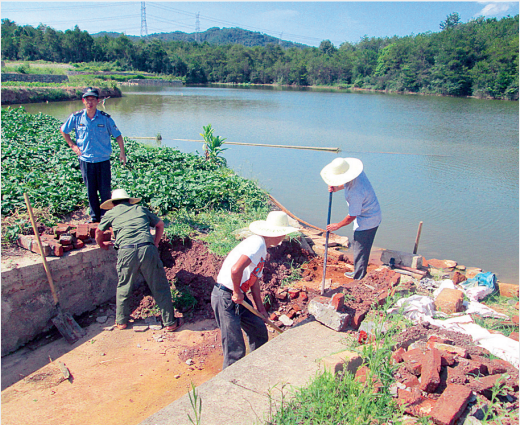
拆除山英塘溢洪道构筑物