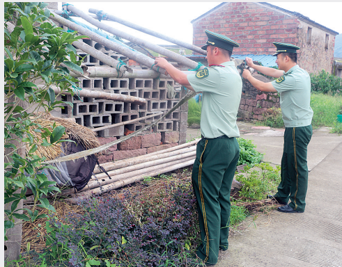
渔民要在帮助村民加固房屋,抵御台风