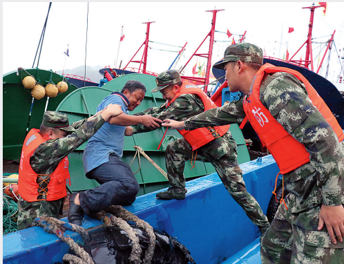
劝说渔民离开船舶

据悉,受“莫兰蒂”和“马勒卡”影响,9月17日8时至18日12时我省大部出现降雨,降雨量8毫米,温州降雨较大为30毫米,9个站超过100毫米,最大的鹿城区黄龙144毫米,未造成严重灾害。截至18日12时,超汛限水位大中型水库由17日的42座减少到29座,部分水库泄洪流量逐步减少。全省江河水位已由30多个站水位超警戒水位或保证水位减少到20个,主要集中在杭嘉湖东部平原等,其他江河水位大部分在警戒水位以下。 据统计,至18日中午,为防御“马勒卡”,全省转移共计26.42万人,台州、宁波等地较17日增加4.4万人;17日尚在撤离回港途中的271艘已全部回港,全省有25030艘渔船已全部回港,5023艘非渔船已在港或处于安全区域,较前一天增加687艘。省防指表示,在未解除警报和正式通知之前,回港避风船只、已转移人员仍需加强安全管理和防范工作,沿海或海岛旅游景区要特别注意观潮安全。