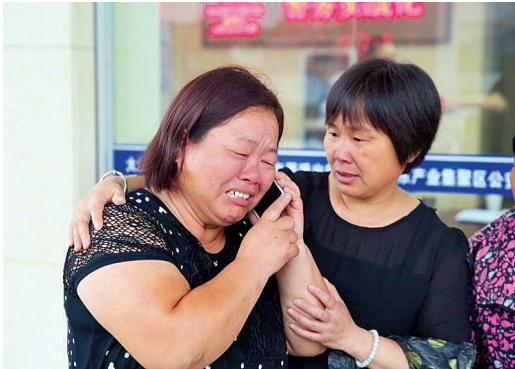
听说找到女儿，小方母亲喜极而泣。

就在警方抓紧案件侦破并营救小方的同时，小方母亲由民警和家人陪着，不停接“绑匪”电话进行周旋，希望为案件的侦办多争取点时间。 “绑匪”的电话多达140个，号码显示有快递公司的，也有公安局的，但回过去都打不通。在这些电话里，的确能听到小方的求助声。听到女儿的声音，加上“绑匪”威胁再不打钱就把小方从大桥上扔下去，小方母亲的情绪一度崩