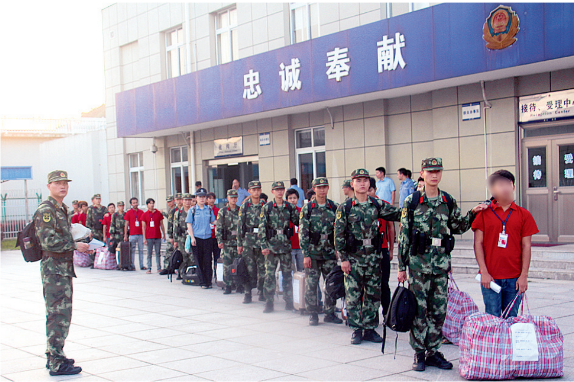
宁波公安边防支队遣返偷渡人员