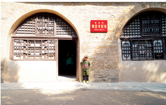
《窑洞与小红军》何德乐 摄