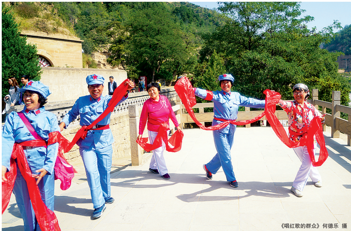
《唱红歌的群众》