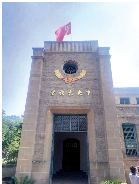
《中央大礼堂》舒剑锋 摄