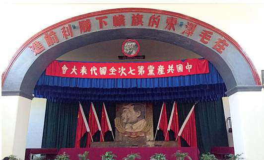
《“七大”旧址》舒剑锋 摄