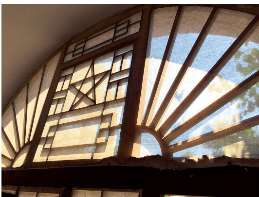
《红星照耀中国》