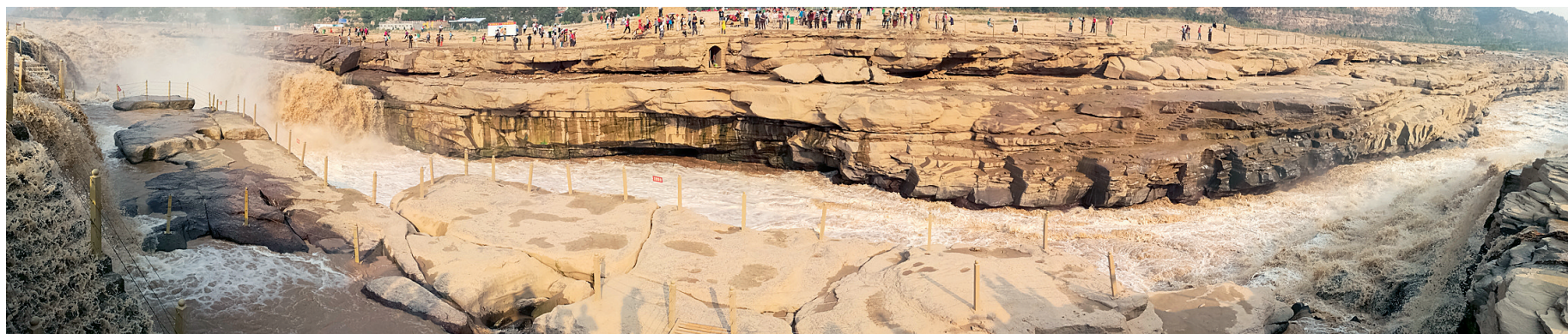
《飞龙咆哮耀九州》蔡长明 摄