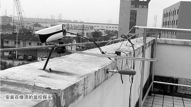
安装在楼顶的监控探头