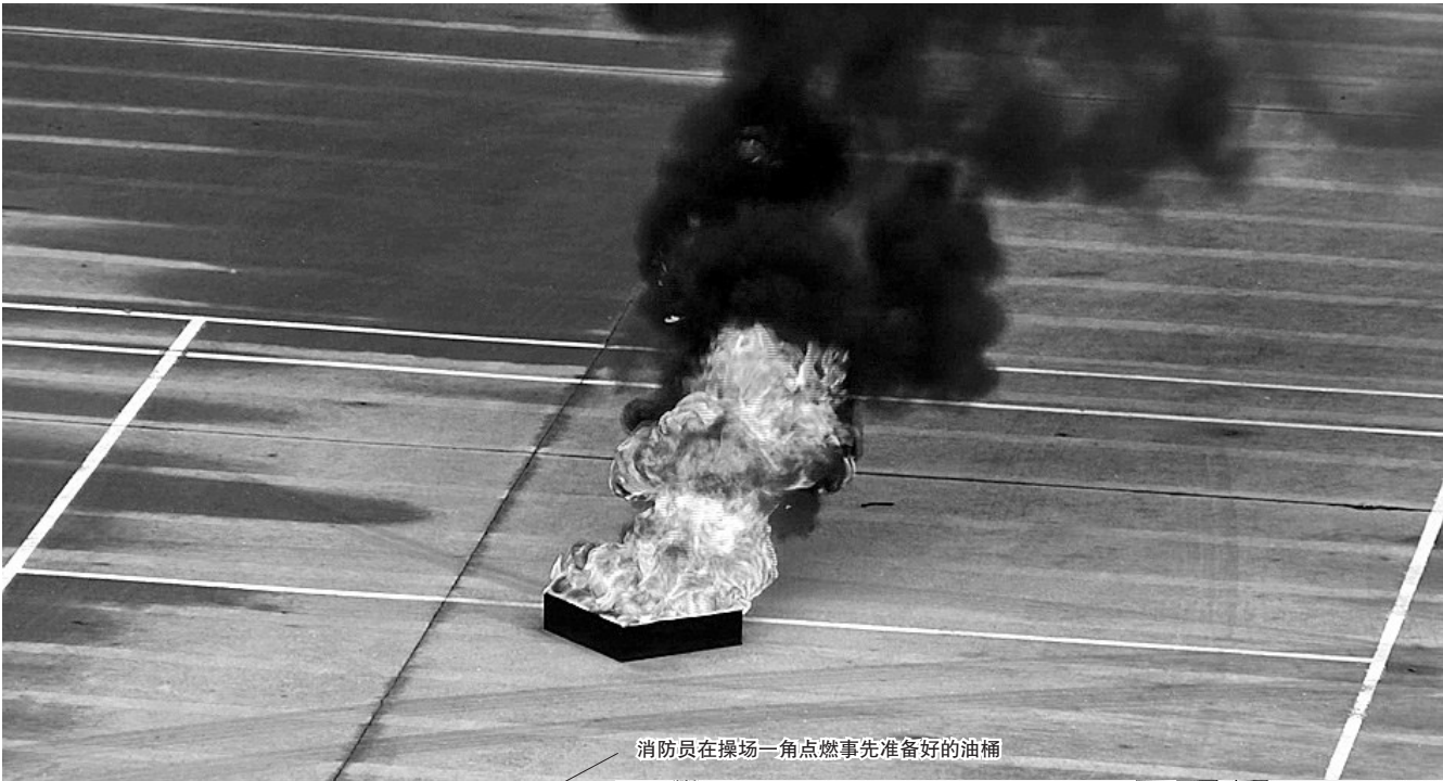
消防员在操场一角点燃事先准备好的油桶