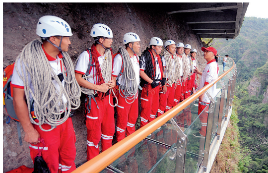
队长向队员们交代作业时的安全注意事项