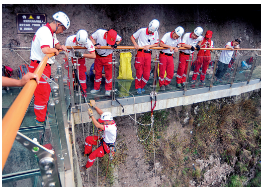
救援队员从玻璃栈道的交界处小心翼翼地悬崖