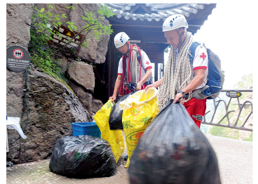
救援队员清理出的垃圾