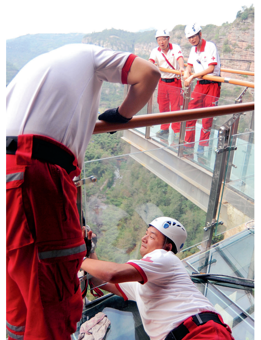
在栈道上穿一根保护绳都非常困难

队员们想托记者对游客们说,穿岩十九峰的美是大自然赐予的礼物,希望大家在欣赏美景的时候不要在这留下垃圾。