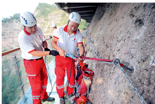
救援队员在栈道崖壁上设置保护点