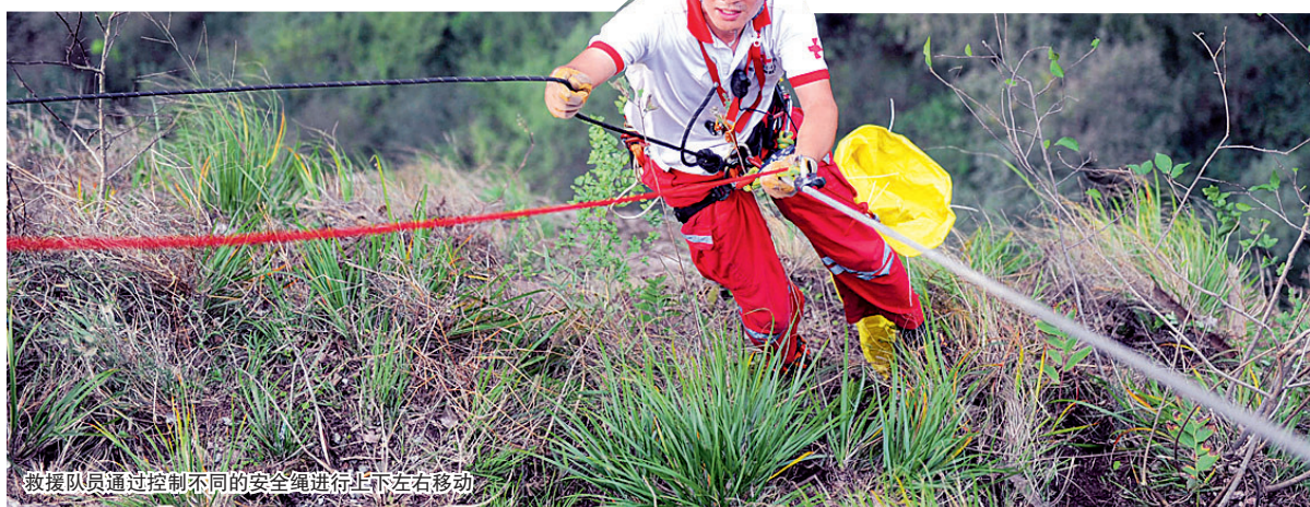
救援队员通过控制不同的安全绳进行上下左右移动

手机网络买保险 赢客户节大礼 官网投保 epicc.com.cn 电话投保 400-1234567