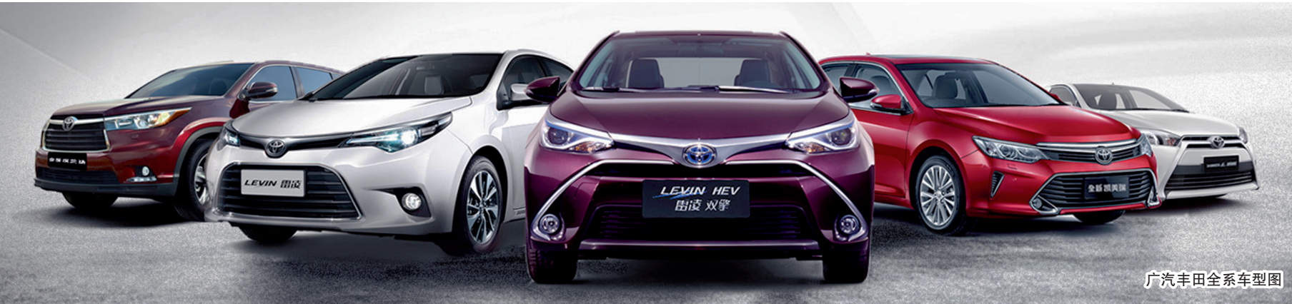
广汽丰田全系车型图