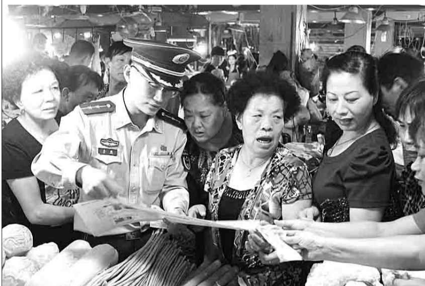
通讯员 吴金阳 戚如波

昨日,温州边防支队官兵走进集市,通过现场讲解、实物演示、发放宣传资料等方式,向群众讲解防范假币的方法和技巧,以提高广大群众的假币鉴别能力和反假币意识。