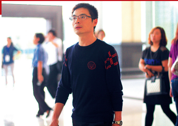
李江参观永康市检察院

信息化和司法的深度融合,有效助推了司法办案规范化水平迈上新台阶,对全国的“阳光检察”信息化建设都有很好的示范作用。