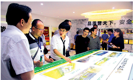
全国法治媒体浙江行活动采访团参观王力集团

从2014年起,王力集团携手公安机关,先后在杭州、嘉兴、宁波、台州、温州、金华等地,举办了数百场主题为“安防进社区平安你我他”的大型公益宣传活动,由民警向居民介绍常见的