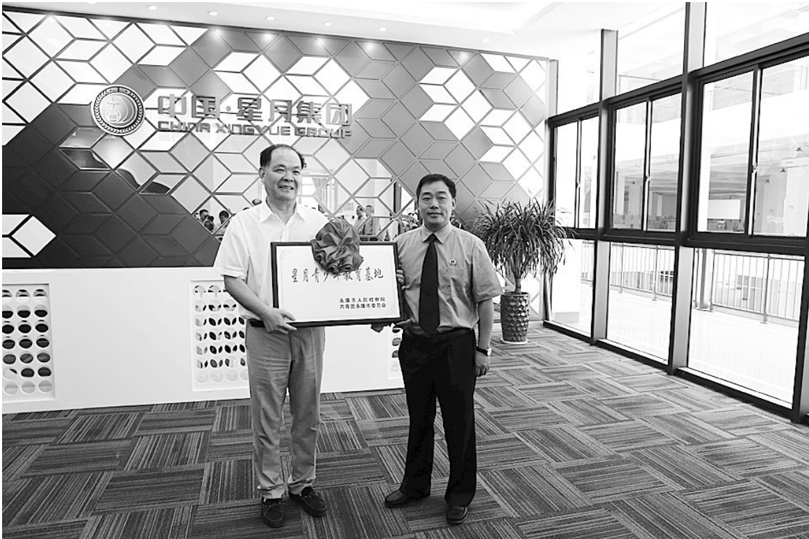
“星月青少年教育基地”授牌仪式

依托内部资源,积极承担社会责任、参与社会治理,这是星月集团一贯的传统。从着眼社会价值、开拓环保生态新产业、以多元化经营实现企业转型升级,到组建义务消防队、成立纠纷调解组织、开展员工法治教育、构建和谐劳资关系,星月集团打造了企业参与社会治理的“星月模式”。