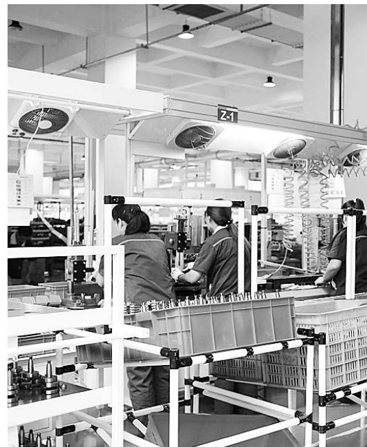
星月集团生产车间

经过3年的精心培育,星月集团很好地实现了传统产业的革新和新型产业的优化布局,现已成为涉足动力、车业、门业、工具、地毯、家电、化工、互联网、新材料、房地产、农业装备、生物医药、金融投资等十三大产业,资产总值50亿元的全国大型工业企业。