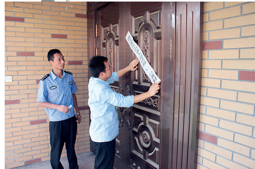
江山法院执行干警将涉案房产粘贴封条并移送强制拍卖

“请你们在3月16日前自觉腾空房屋,按期履行付款义务,否则法院将按照法律规定采取强制腾退措施。”3月1日,衢江法院陈法官到浙江某药业公司厂房内张贴腾房公告,并告知被执行人及其他租赁户相关事宜。