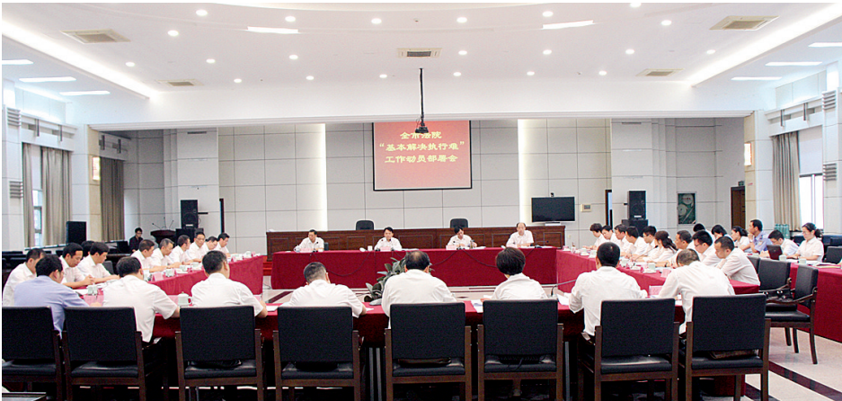
衢州中院对全市法院“基本解决执行难”行动员部署

衢州中院深化执行信息公开,执行裁判文书按规定100%及时上网公开,并落实12368平台、信息查询平台、短信回告等执行信息公开和告知措施。衢州全市法院基本设立专门执行接待场所,统一负责执行法律法规释明、执行疑问解答、执行当事人及涉执信访人接待等事务。今年以来,全市法院执行事务接待中心或窗口共接待来访来电人员12246余人次,有效地提升了当事人对执行工作的满意度。