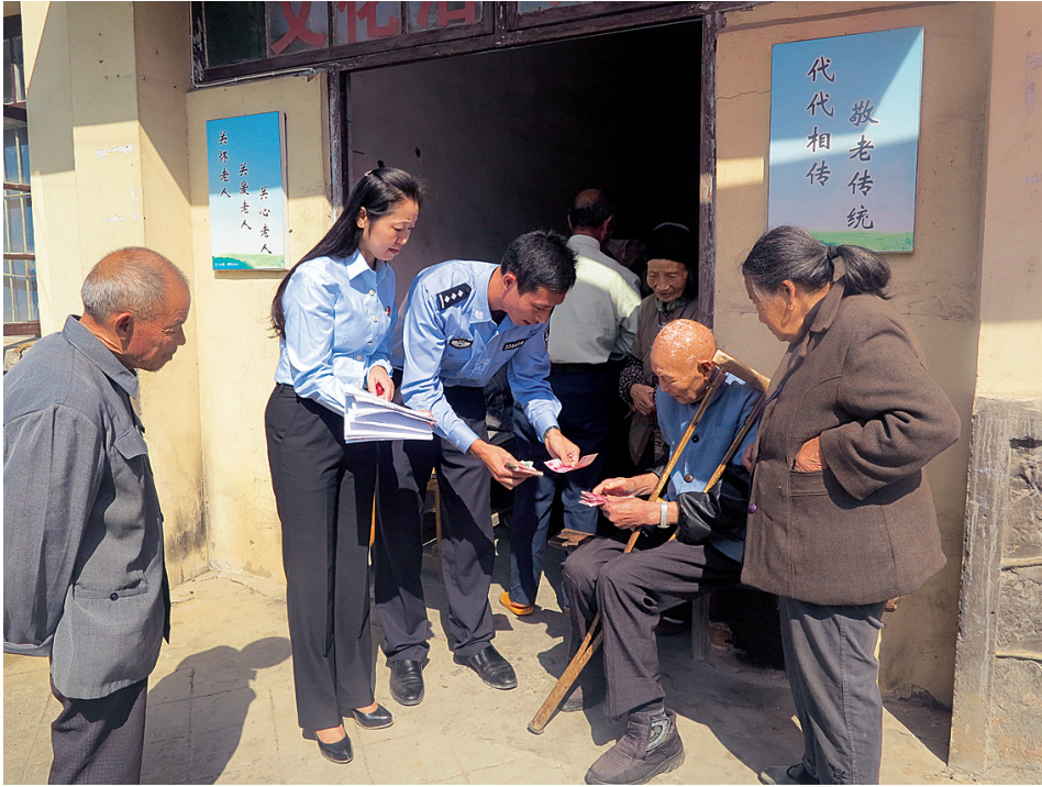
江山法院执行干警上门为七旬老人送赡养费

在执行“大会战”中,这样的专项执行并不是个例:柯城法院打破常规工作时间,开展“凌晨集中执行”,今年以来共执行完毕涉民生案件183