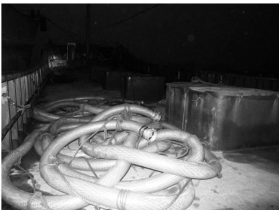
走私船只上布满粗大的油管