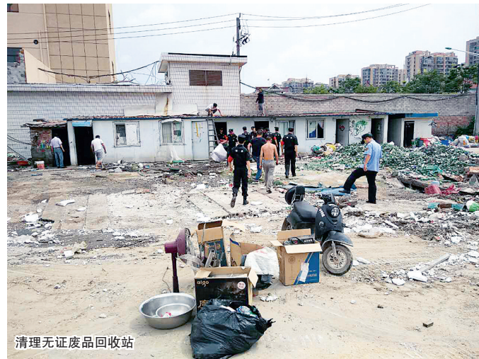
清理无证废品回收站