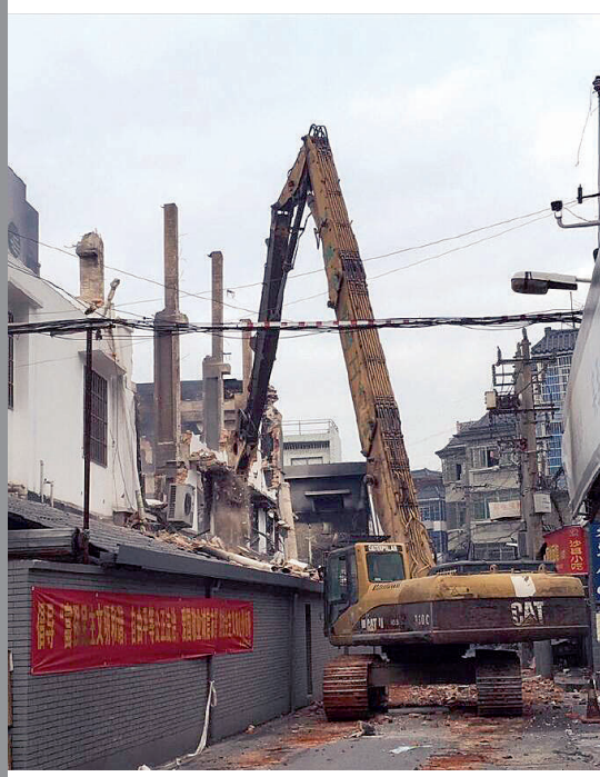
昨天上午封闭解除后,有关部门对影响通行和安全的火灾后建筑进行拆除