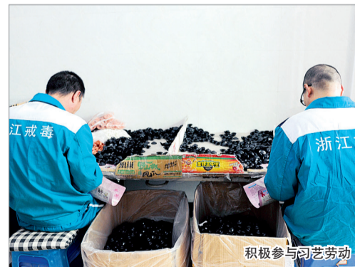
积极参与文艺劳动