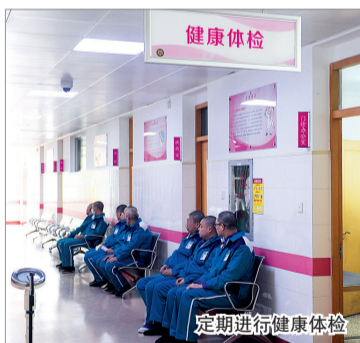
定期进行健康体检