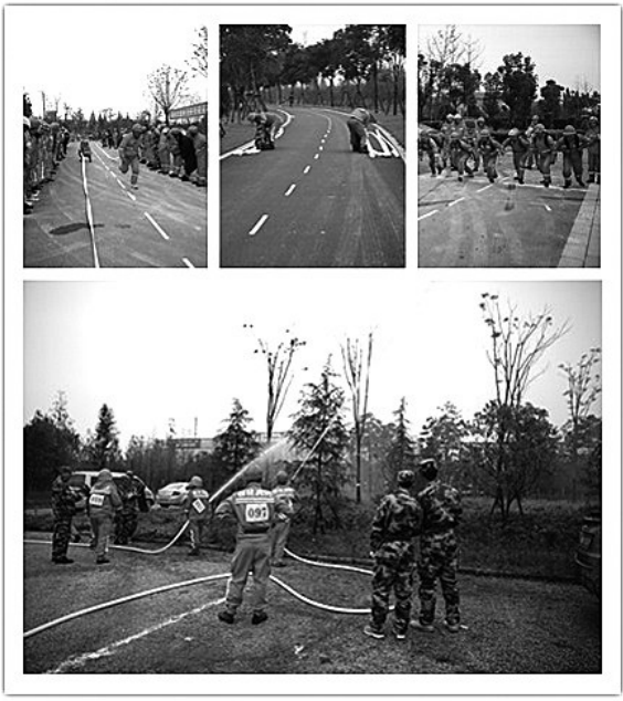
森林消防技能运动会

衢州市林业局相关负责人介绍,目前,各县(市、区)基本实现了“资源增长、农民增收、生态良好、林区和谐”的创建目标;柯城区、衢江区、常山县、江山市、龙游县等先后成功创建“平安林区”县(市、区);衢州市林业局也连续两年被衢州市委、市政府评为“全市平安建设暨综治维稳工作先进集体”。