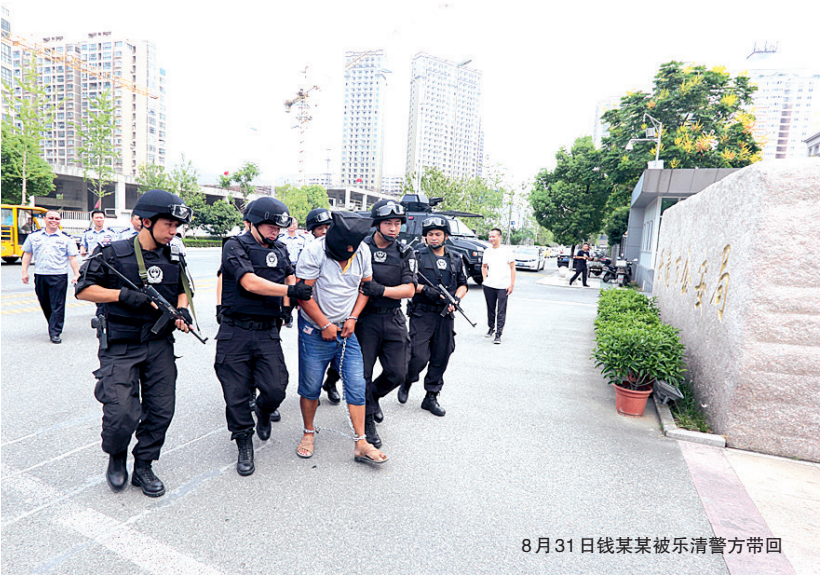
8月31日钱某某被乐清警方带回