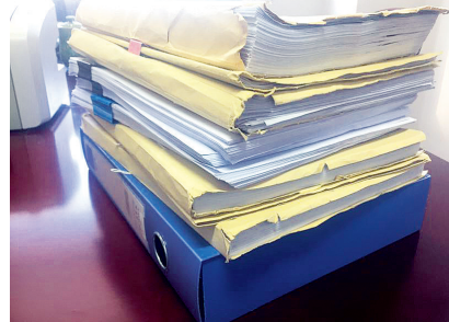
钱某某一个人的案卷资料就有这么厚

8月28日上午,在属地刑侦大队、辖区派出所的配合下,抓捕组民警在湖北省五峰县渔洋关镇某歌舞厅内,将钱某某成功抓获。