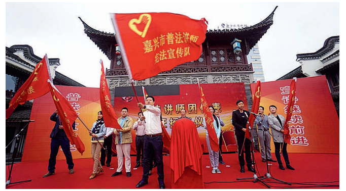
嘉兴市举行普法讲师团宪法宣传队授旗仪式

“大爷,您这个问题有几种法律途径解决,听我跟您一说……”金华何宅菜市场门口,戴着小红帽的普法志愿者与前来咨询的群众面对面,一对一解答疑惑。 “宪法宣讲浙江行”活动启动以来,金华市司法局联合金华市法学会开展“宪法润乡村”活动,组织全市近千名普法志愿者和宪法宣讲团成员,在各乡村、街道悬挂宣传横幅、摆放宣传展板、设立咨询台、发放宣传资料宣传品等,为群众提供法律咨询、讲解宪法及法律法规知识。 普法志愿者、宣讲团成员的身影还活跃在全省各地各条普法工作战线上。在衢州,由101名法学专业人士组成的宪法宣讲讲师团颇受欢迎。截至目前,全市共开展宪法宣讲85场次,发放宪法资料5万份,受教育群众达10万余人。