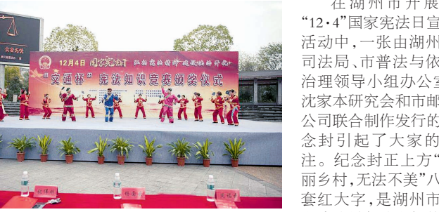
开化县举行“交通杯”宪法知识竞赛颁奖仪式

两天后的杭州运河法治文化茶馆内,一场以“宪法走近你我”为主题的原创法治文艺专场演出也吸引了周边不少群众观看。大家除了能看到魔术、快板等原创法治节目外,主办方还推出了《法印运河》微视频作品,将普法工作完美融入沙画之中。此外,“12·4”国家宪法日期间,拱墅区还举办了中小学法治书法征集大赛、社区工作者法律知识培训等一系列宣教活动。