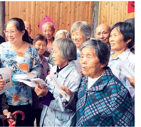
金华市“法润乡村”普法志愿服务队送法到农村

而在湖州德清,浙江律信律师事务所的律师则为莫干山高新区内的企业经营管理人员和职工代表深入浅出地分析了宪法与劳动者权利、公民信息保护、名誉权保护等的关系。现场设立的流动宪法法律宣传咨询台,为企业经营管理人员和职工提供法律咨询60余人次,员工们还收到300余册宪法书籍、宣传资料等礼物。