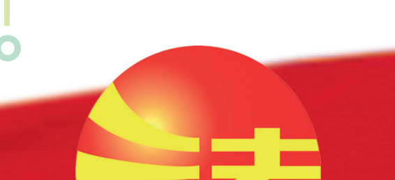
温州市举行“12·4”国家宪法日法治文化汇演

在“12·4”国家宪法日活动期间,绍兴和湖州的公共法律服务网,为当地百姓提供了又一全新线上学法渠道。公共法律服务网囊括了宪法宣传在内的普法动态、普法短剧、普法课堂、普法人物、普法动漫、新法速递、专题解读等各类最新普法资讯。同时,两个平台还整合了法律援助、法律咨询、公证服务、人民调解、行政许可等十余项司法行政职能,实现普法产品供给和法律服务的一体化运作,保障群众“找得到、学得着、用得上”。