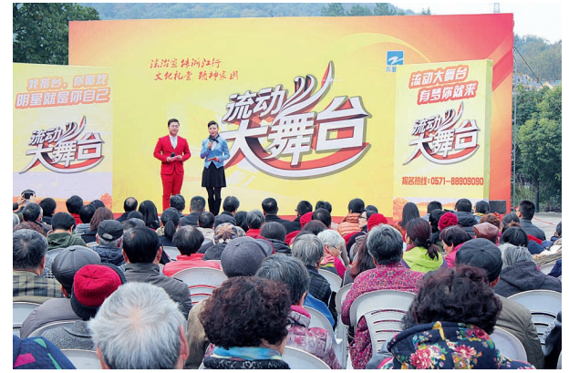
杭州市上城区举办“12·4”国家宪法日主题宣传暨浙江电视台“流动大舞台”法治文艺演出