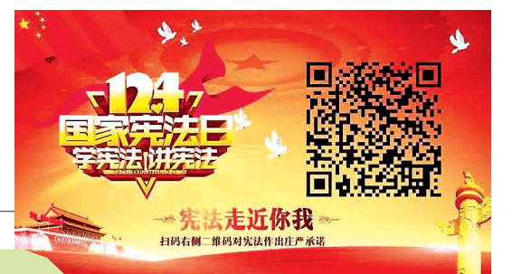
省司法厅、省普法办制作的“宪法走近你我”H5作品