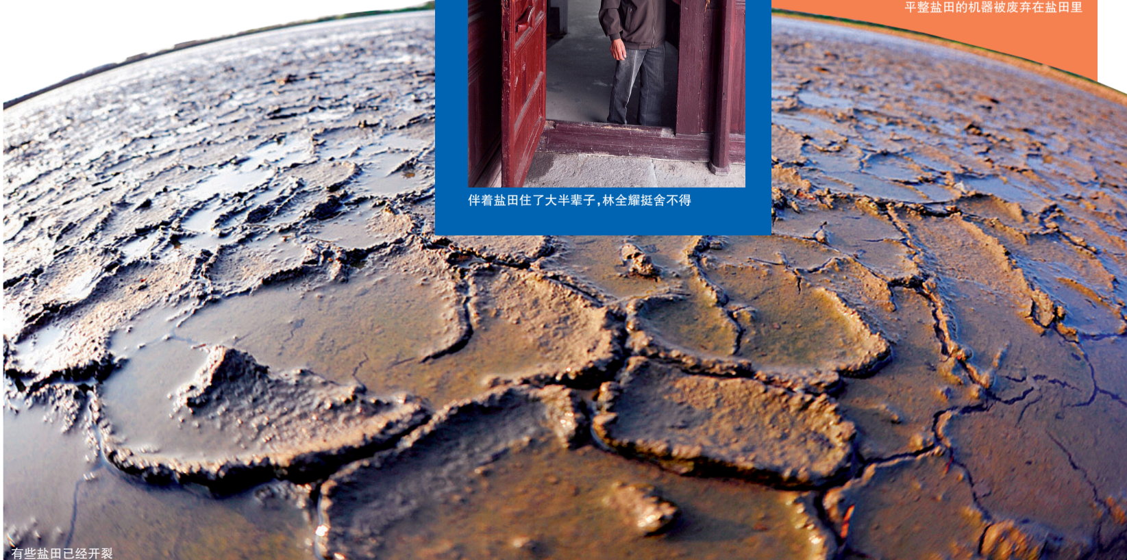
有些盐田已经开裂