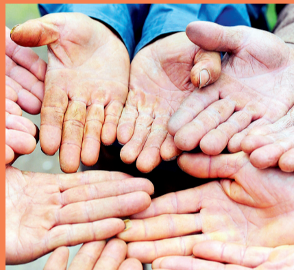
今后不再晒盐,老盐民的手也能歇歇了