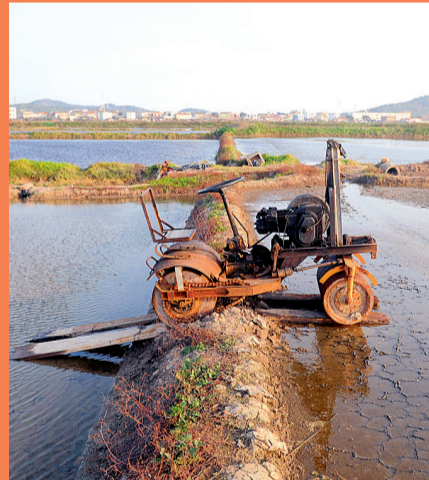
平整盐田的机器被废弃在盐田里