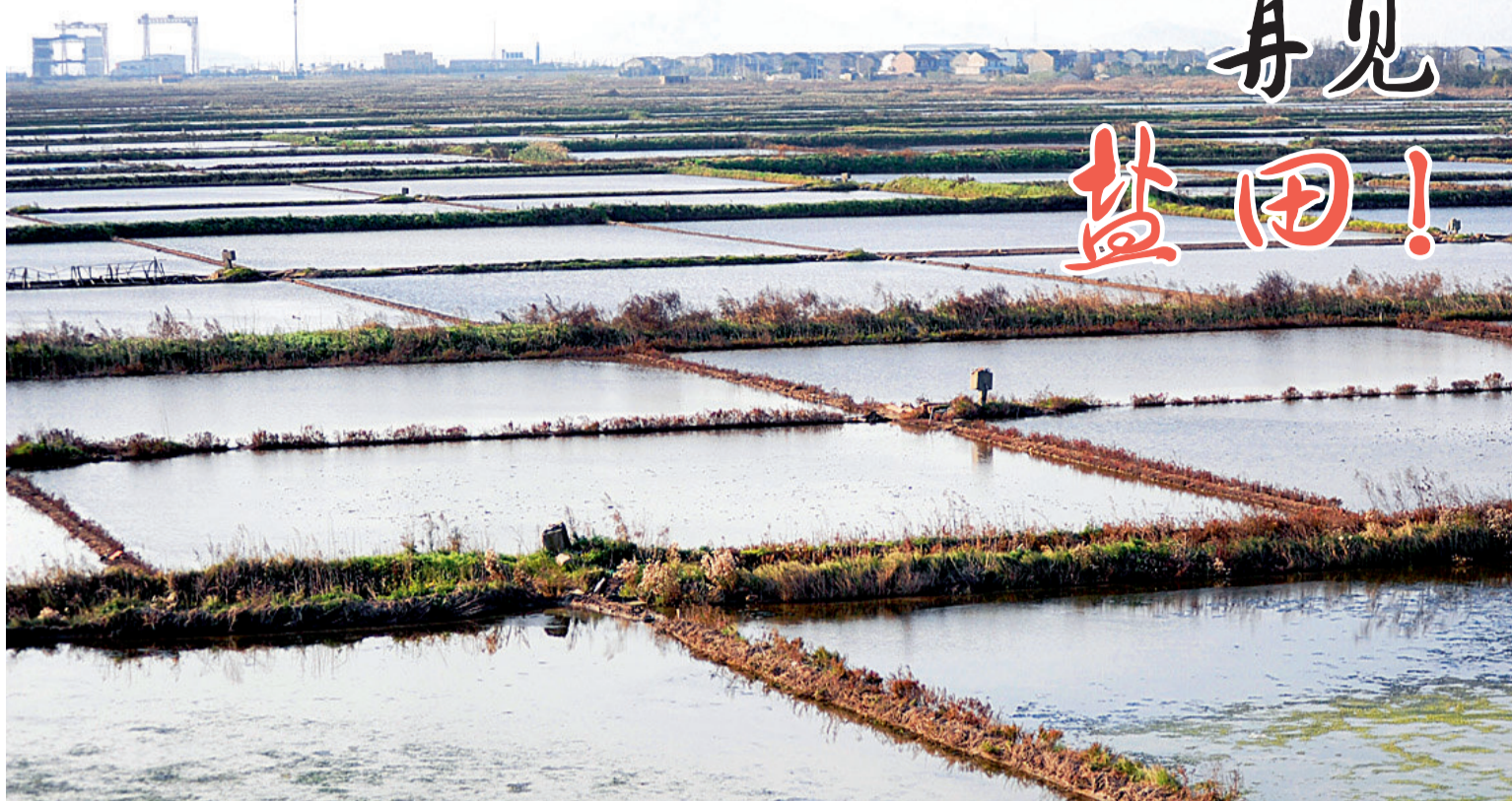
大片即将消逝的盐田