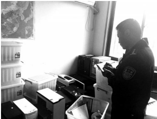
民警清点嫌疑人的作案工具

从上当受骗的被害人情况来看,由于犯罪团伙作案目标主要针对游戏爱好者,大多数被害人是在校大学生、高中生。在办案过程中,民警发现还有很多被害人没有报案。 警方提醒:网民网上购物时,一定要到正规网站,不要轻易打开对方发来的任何文件、链接;在收到安全软件弹出的安全风险提示时,也要提高警惕,避免蒙受经济损失。