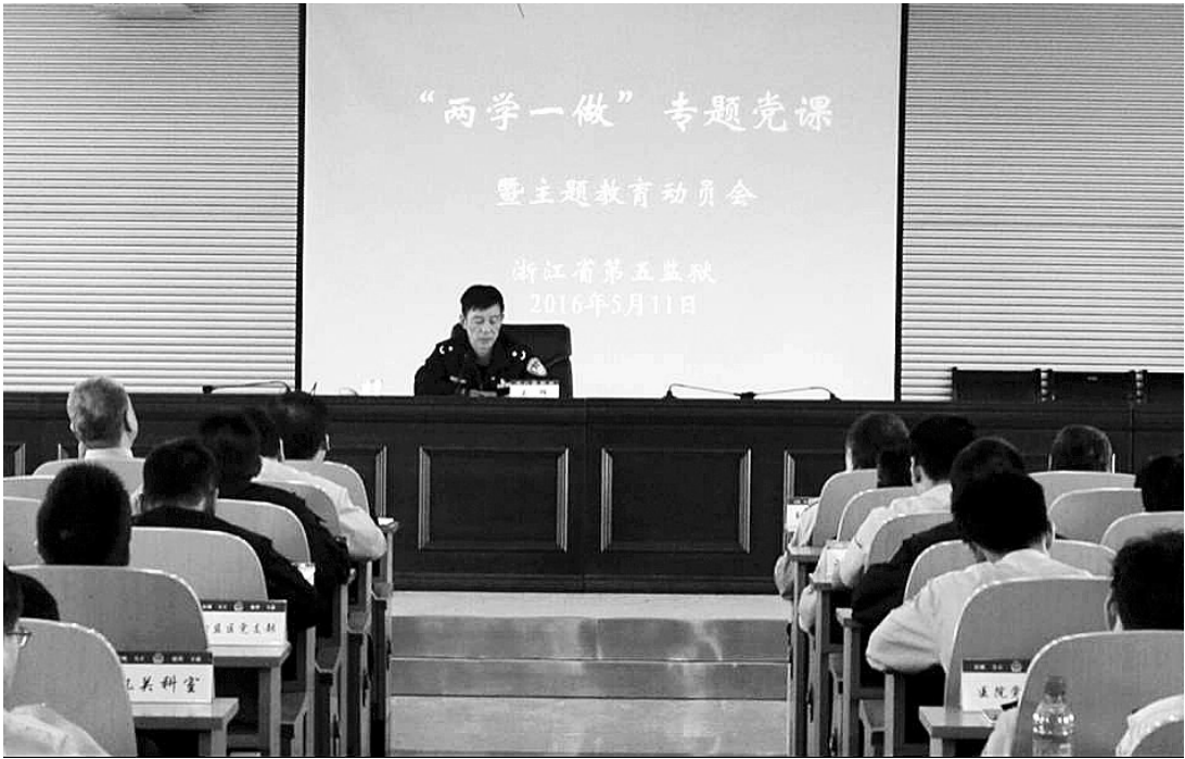
党委书记上“两学一做”专题党课

对“学”的认知,往往在“检”中一步步廓清。 “是否存在参加宗教和封建迷信活动,是否存在传播社会上、网络上不利于国家政治的小道消息,是否存在单位组织集中学习和开会时玩手机、打瞌睡……”今年 6 月,一份《对标检视 学做合格党员》的系列主题讨论活动方案下发到了各监区党支部,监狱对照党章党规标准,梳理出党员民警工作中的理想信念、党员意识、宗旨意识、工作作风、廉政纪律、生活作风等 6 个方面 85 个问题,为党员民警制定了一份自查清单。