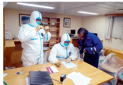
对外籍船舶进行卫生检疫