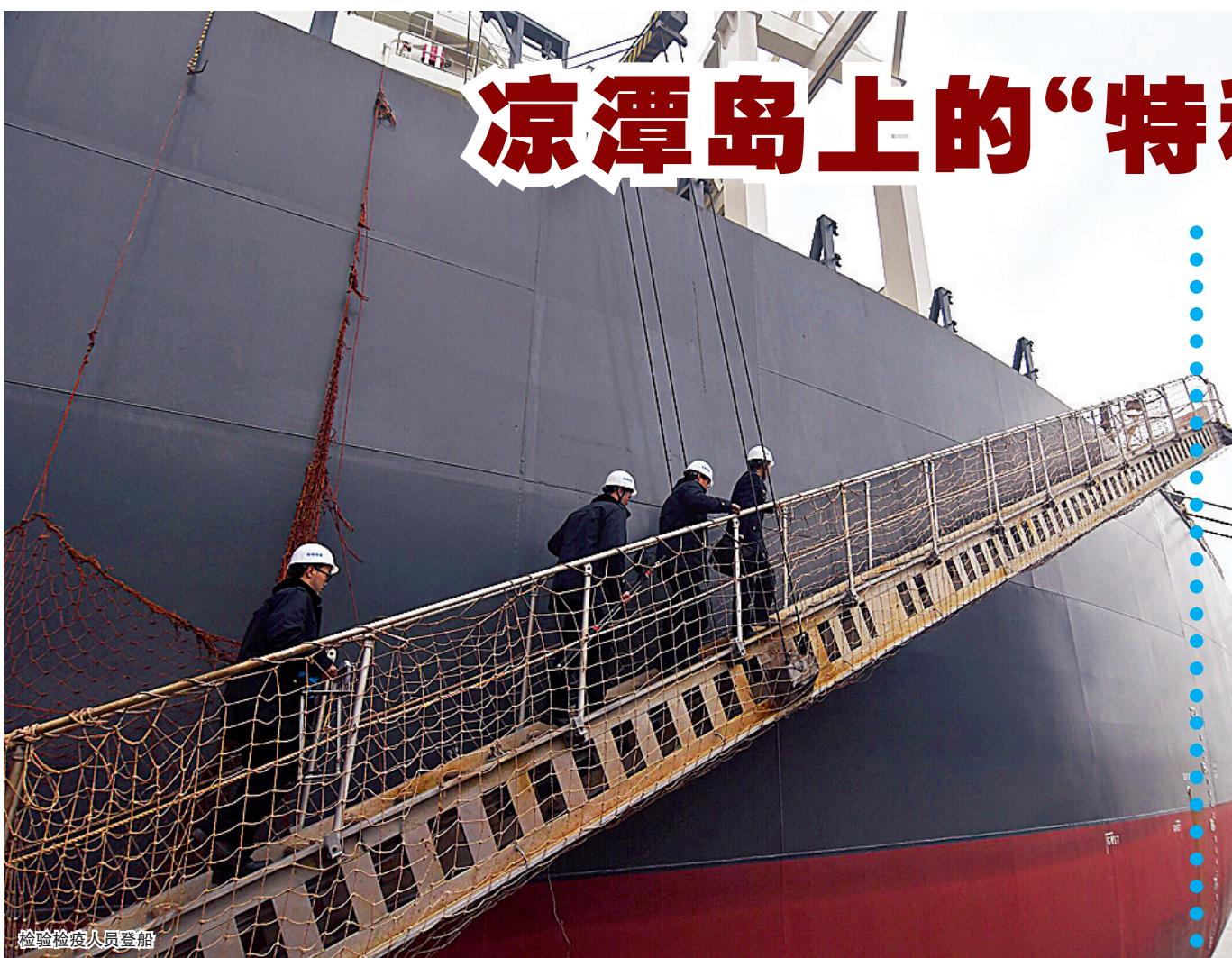
检验检疫人员登船