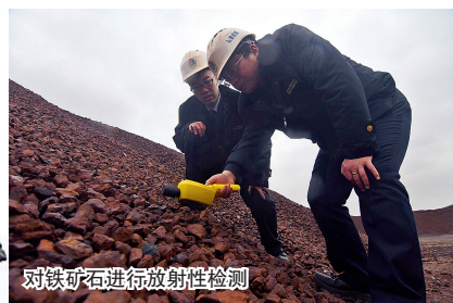
对铁矿石进行放射性检测