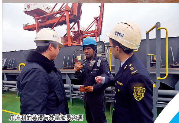
用流利的英语与外籍船员沟通