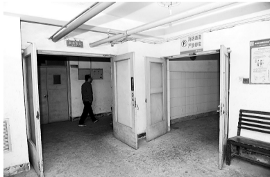
医院安全出口处的常闭门违规敞开

“这么豪华的家居城里,竟然存在这么多火灾隐患,万一发生了火灾,你们所有的生意就都白做了。”检查人员告诉记者,环顾了整个家居城,偌大的二楼竟然没有找到烟感报警器,展厅的后期装修也影响了防火卷帘门的正常使用,就连最基本的灭火器也未按