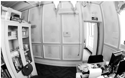
疏散通道被违规改造造成办公区