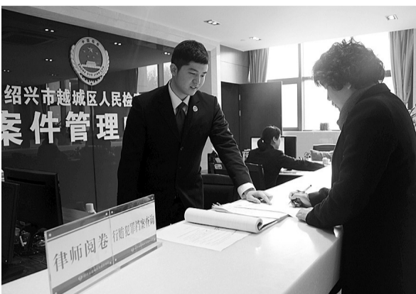
本报记者 许梅 通讯员 范跃红 史集

控辩大课堂、检律圆桌会、检律业务研讨交流会……过去的一年,你的微信朋友圈被这些检察官和律师之间的“亲密”活动刷屏吗?曾经,检察官和律师,被称为“天生的对手”,但随着法律共同体意识的确立,“和而不同,亲上加清”成了浙江检察官和律师构筑新型检律关系的热词。