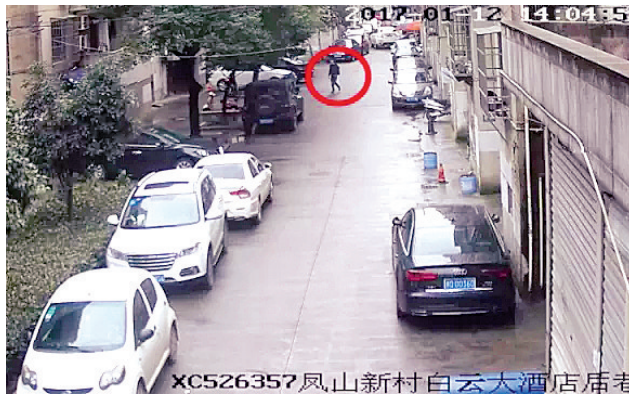
监控视频中换装前的嫌疑人

1月12日晚上9点多,新昌县公安局刑侦大队接到报警,称城区沿江中路一高档小区内发生一起盗窃案。 失主家中一只保险箱被翻了个“底朝天”,经他初步清点,高档手表、翡翠手镯、金条、美金等大量财物被盗,案值有100余万元。 经现场勘查,民警发现犯罪嫌疑人具有较强的反侦查意识,作案手法非常熟练,在现场并未留下太多有价值的线索。 幸好,该住户家的保姆提供了一条重要线索——当天下午1点多,她从外面回到家,发现主人房间内有一只黑色