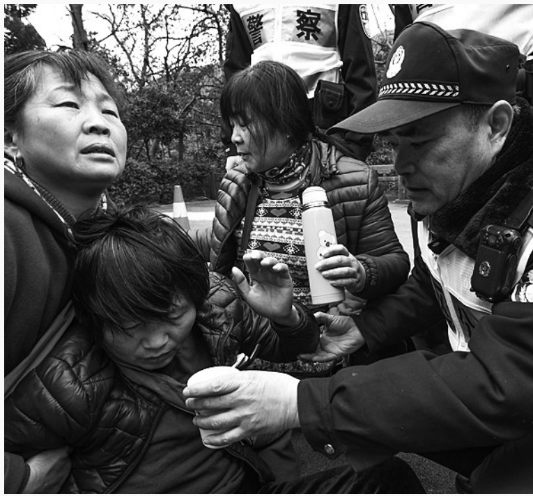
老陈为晕厥的夫人送上热开水