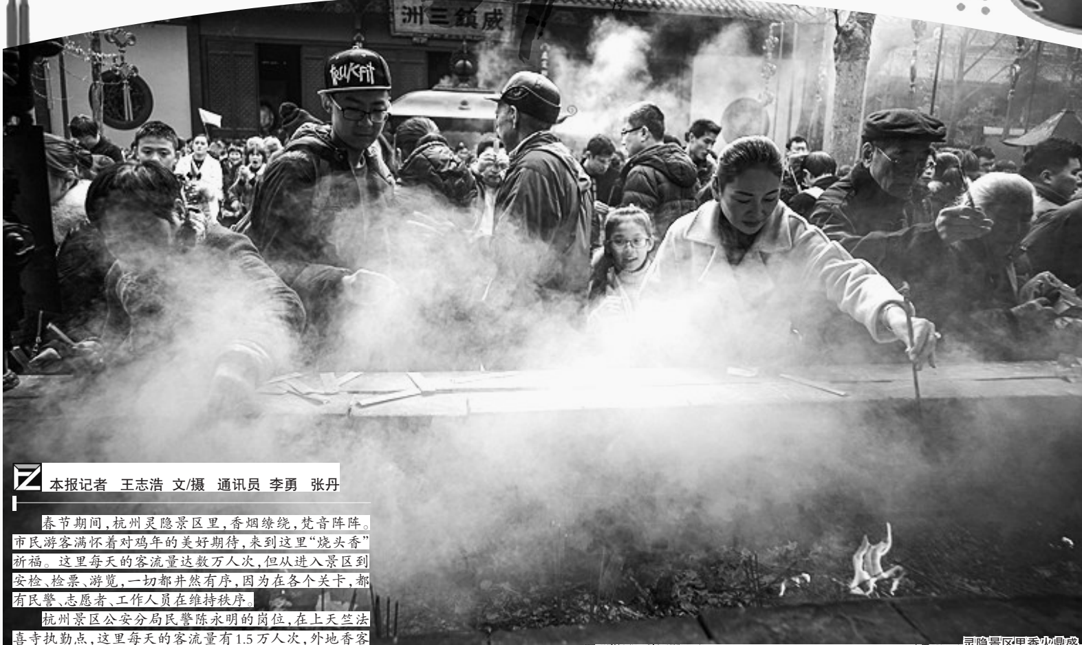
灵隐景区里香火鼎盛