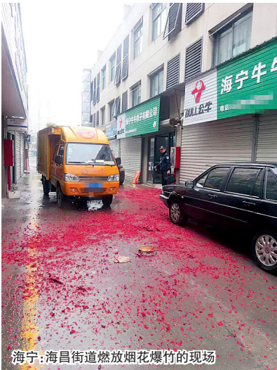
海宁:海昌街道燃放烟花爆竹的现场