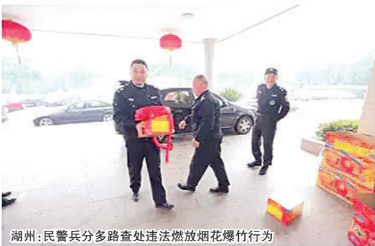
湖州:民警兵分多路查处违法燃放烟花爆竹行为